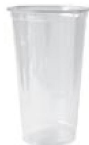
SHAKER POHÁR 0,25L